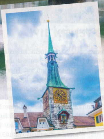
Der Zytglogge-Turm aus dem 13. Jahrhundert.

Blick über die Aare auf die Altstadt mit der St.-Ursen-Kathedrale.